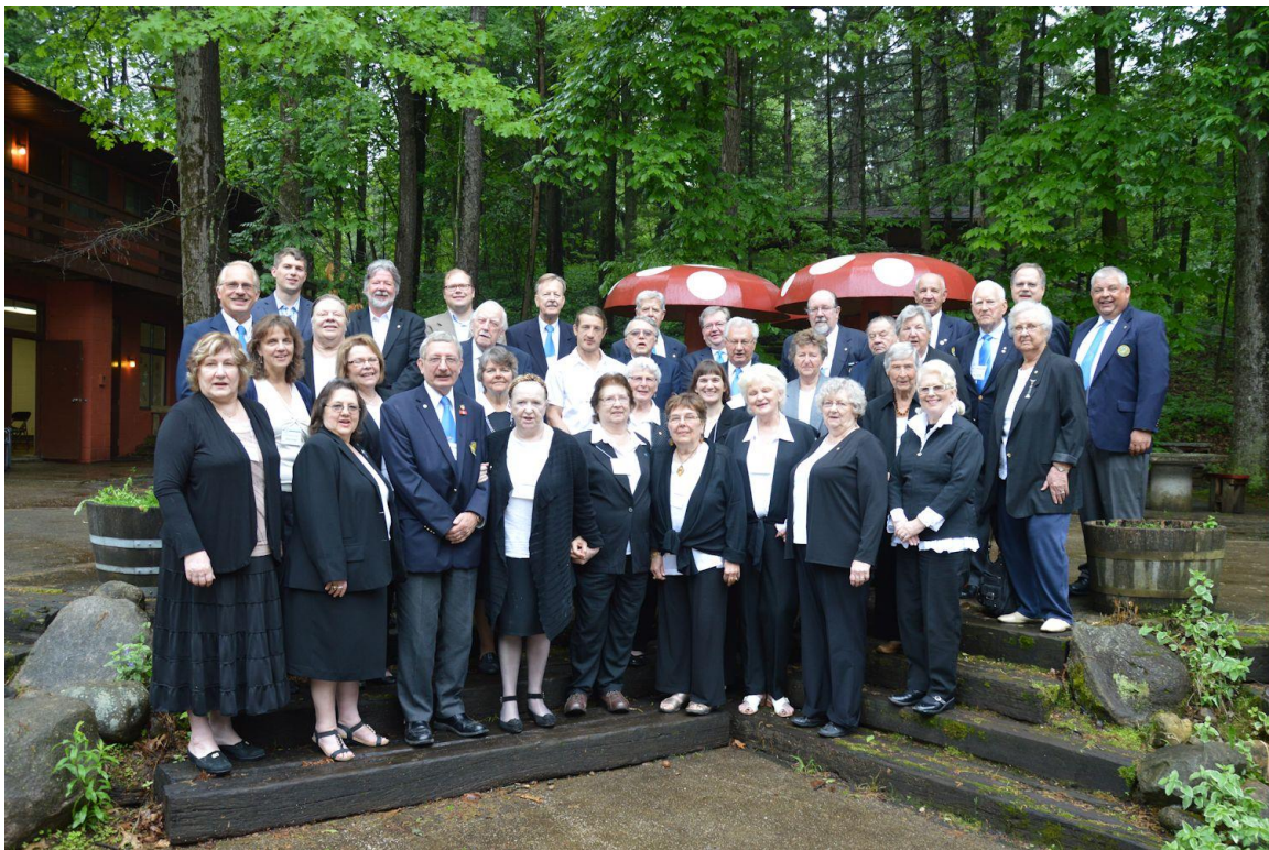
65. DV ASV delegātu sapulces dalībnieki un viesi, Gaŗezera